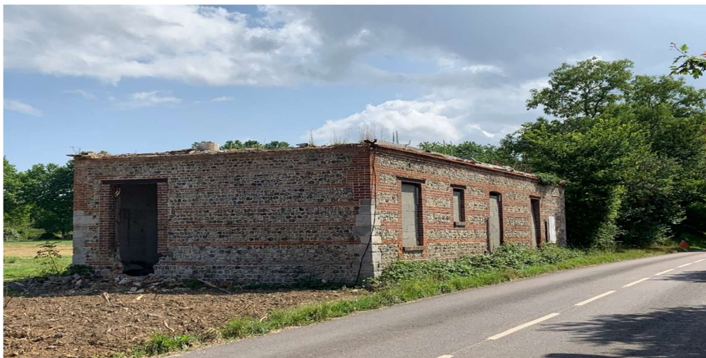
La grange que la mairie a restaurée