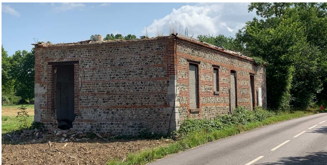
La grange que la mairie va restaurer

La solution retenue préserve le caractère de cette partie du village, et l'agrément des futurs habitants. C'est une bonne nouvelle. Reste à replanter la partie du talus qui a été détruite.