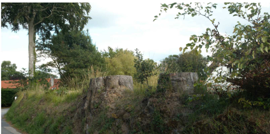
Un talus classé qui a été détruit par la mairie après expertise, suite à la délivrance d'un permis de construire !!

Nous demandons que la mairie ne délivre plus de permis de construire qui conduise de facto à la destruction des talus classés du village !