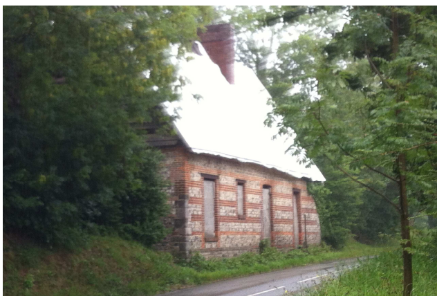
La grange que la mairie va restaurer

Le bâtiment rural en péril dont nous avons déjà parlé les années passées devait devenir un carrefour en rond-point. Bonne nouvelle pour ce bâtiment : racheté par la mairie pour un montant symbolique, il devrait être restauré.