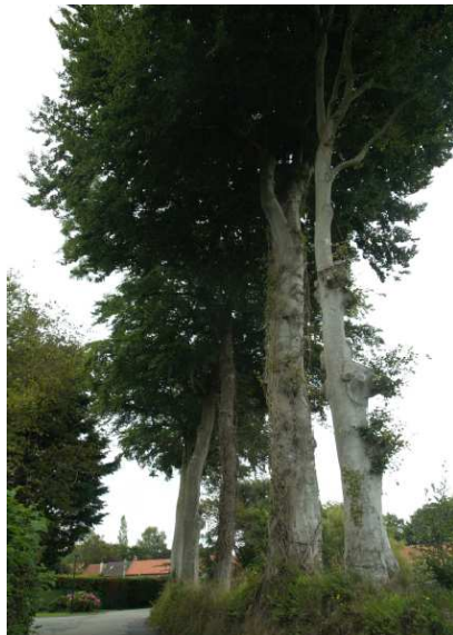
Talus avant et après sa destruction

Nous demandons que la mairie ne délivre plus de permis de construire qui conduise de facto à la destruction des talus classés du village !